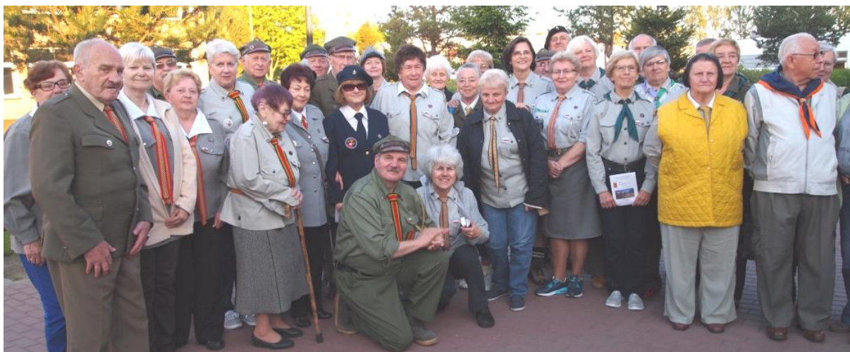
Wspólne zdjęcie uczestników z Wielkopolski: Kręgi Seniora z Janowca Wlkp, Poznań – Owar, Dziewiatacy, Kiekrz, Leszczyna, Wschowa, Szamotuły, Piła, Złotów, Konin – PUCK 22.06.2015 r

Tegoroczny rajd, w którym uczestniczyło na trasie seniorów 146 druhen i druhow z całej Polski – w tym i my – członkowie Kręgu OWAR z Poznaniu, zaczął się i zakończył w Wejherowie. Po przyjeździe do tego pięknego miasta poczęstowani zostaliśmy bigosem i tak wzmocnieni ruszyliśmy przez piękny park miejski im. Aleksandra Majkowskiego - ulubione miejsce spacerowiczów i turystów łączący zabytkowe centrum miasta i Kalwarię Wejherowską – na zwiedzanie. Na placu Jakuba Wejhera – założyciela miasta, przy jego pomniku wielu uczestników wyjazdu zrobiło sobie zdjęcia, obejrzelśmy także zabytkowy ratusz oraz kolegiatę - kościół pod wezwaniem Świętej Trójcy, stojący w miejscu pierwszego kościoła ufundowanego przez Jakuba Wejhera i wybudowanego na niezamieszkałym, dziewiczym terenie w latach 1643-1644. W latach 1754-1755 pobudowano nowy kościół w stylu barokowym, później rozbudowany i w 1927 roku oddano wiernym w użytkowanie powiększoną świątynię, która do dziś stoi w niezmiennym kształcie i wielkości. Kolegiata pełni rolę sali koncertowej. W jej wnętrzach występują artyści, zespoły chóralskie a także orkiestry z programem religijno - kulturalnym. Tuż obok głównego wejścia do Kolegiaty, znajduje się jeden z cenniejszych zabytków Wejherowa, przyrynkowy domek szczytowy, o konstrukcji szachulcowej z tzw. wystawkami (rzadkością architektoniczną), mieszczący dawniej szpitalik, w którym zamieszkiwali ubodzy mieszkańcy Wejherowa.